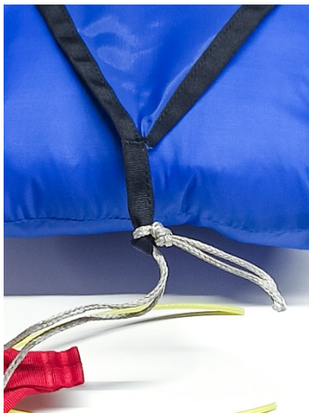
ひばり結びを締める