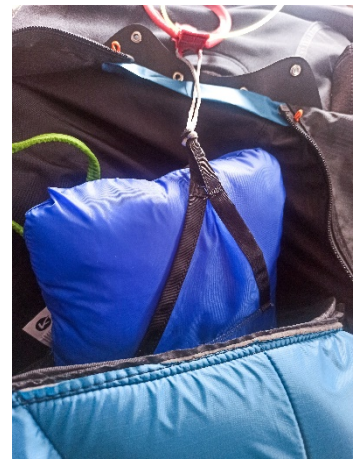
長さの変更が完了したら、上 に示すように、カニバルレー ス II とレース ST のコンテナ にレスキューパラシュートを 取り付けることをお勧めしま す。

拡張アタッチメントまたは特別な接続ポイントを備えた他のポッドモデルでは、個々の長さを調整して、同じタイプの変更が必要になる場合があります。