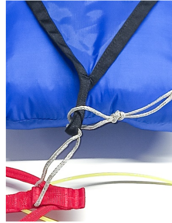
簡単な結び目を結ぶ