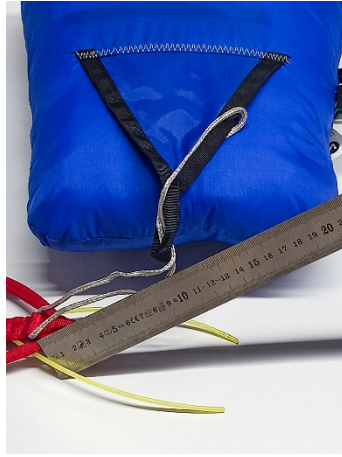
おおよそ 10cm を測る