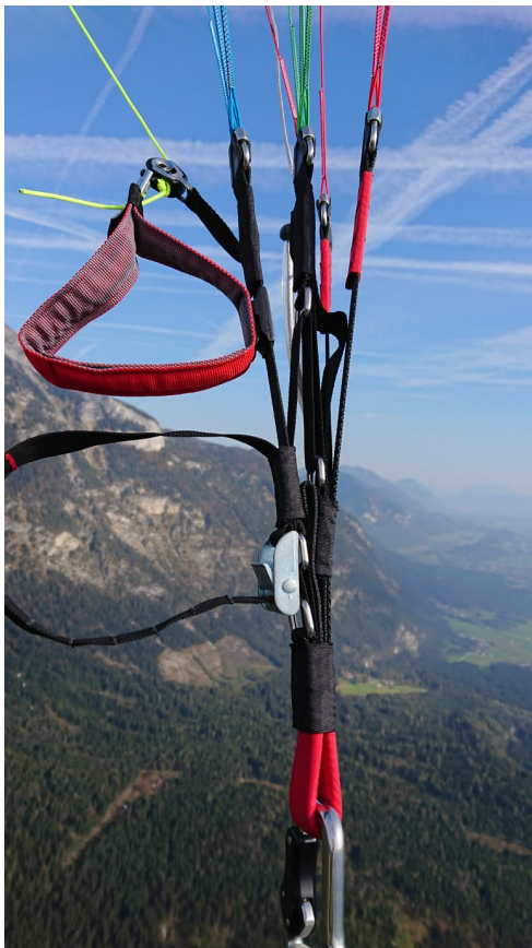
トリマークローズ時