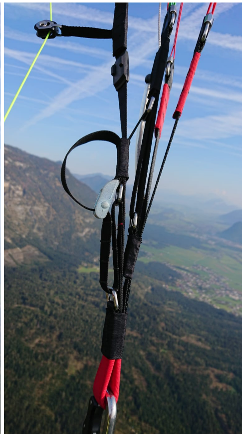
トリマーオープン時